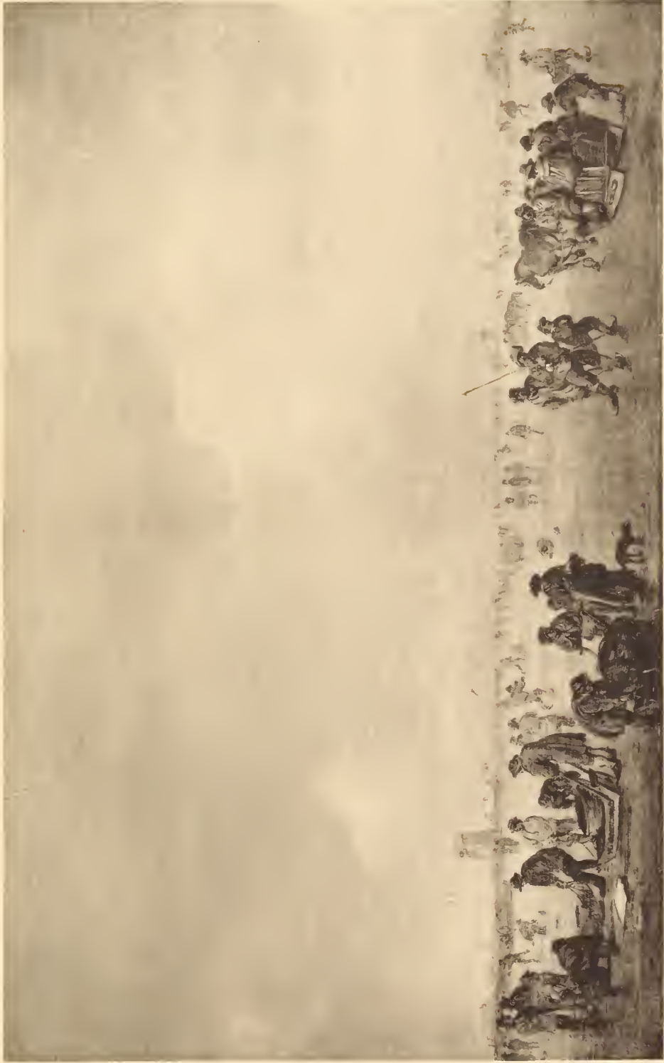
Vente le 23 février 1804, Dir. Frederik Muller & Cie (Ant. W. M. Meusing).